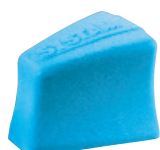
Coussin d'abduction de hanches