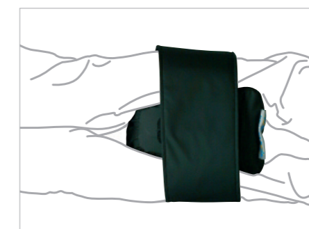
EN POSITION LATÉRALE LORS DES SOINS