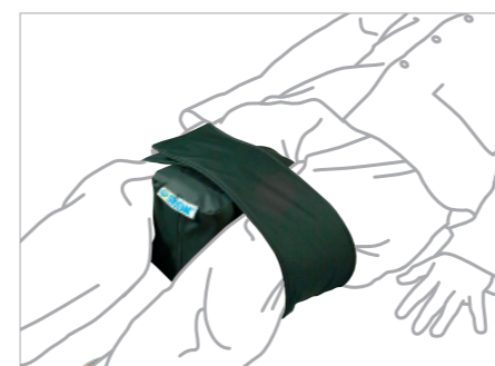
EN DÉCUBITUS DORSAL