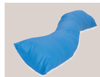
Base de positionnement