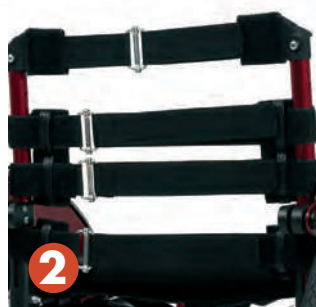
Assise et Dossier réglables en tension