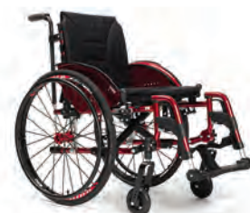
Nombreuses options disponibles

Poids de transport : à partir de 9,28 kg