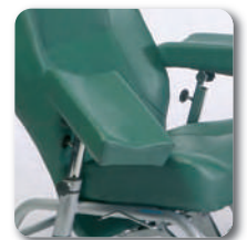
Manchettes de prélèvement