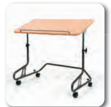
Table 378 disponible