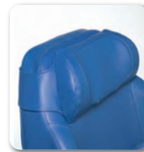
Appui-tête - B55