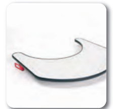
Tablette - B12