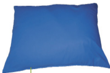
Base de positionnement

Le coussin universel cale, soulage et prévient les risques d'escarre. Il s'installe sous la tête ou entre les jambes et facilite le retournement du patient lors des soins.