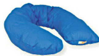
Base de positionnement