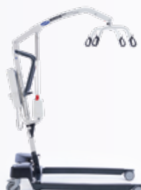
Birdie EVO XPLUS

Une version évoluée du Birdie, leader sur le marché des lève-personnes mobiles, conçu pour réaliser des transferts sûrs à la fois au domicile et également en collectivité.