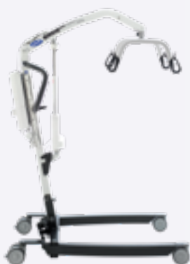
Birdie EVO COMPACT

La gamme des lève-personnes mobiles. Conçue pour les patients et les aidants.